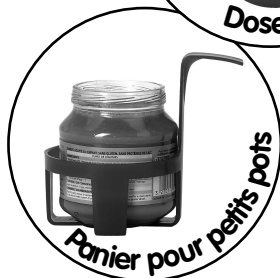
Panier pour petits pots