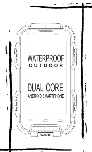
EVOLVEO StrongPhone D2