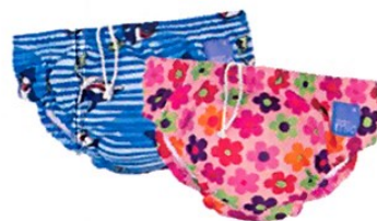
бански гащички за многократна употреба