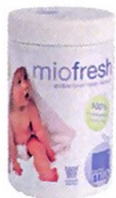
miofresh дезинфекционно средство за пелени