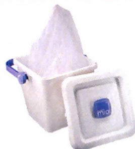
заклучваща се кофа за пелени & мрежички за пране