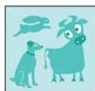
Жетони с животни