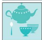
Жетони с предмети