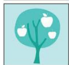
Жетони, показващи плодове, които растат по дърветата