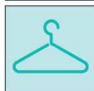
Жетони с дрехи