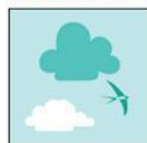
Жетони с неща, които могат да летят

Бележка: картата “категория на сортиране” пояснява кои жетони в коя категория спадат.