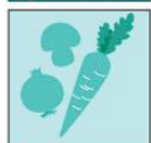
Жетони със зеленчуци