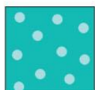
Жетони с точки