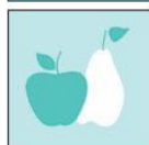
Жетони с плодове