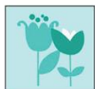
Жетони с цветя