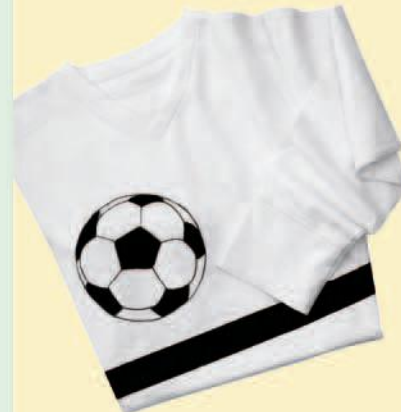
Textil Painter, Textil