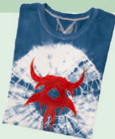
EasyColor, fun & fancy tex