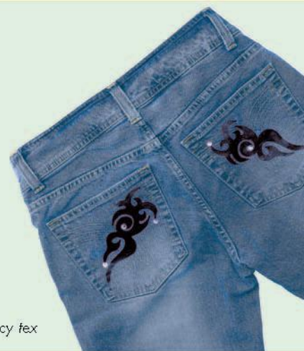
fun & fancy tex

Спортът е забавление. Особено когато носите такива страхотни дрехи. Боята е от Marabu, дизайнът и идеите - от вас: това е печеливша комбинация.