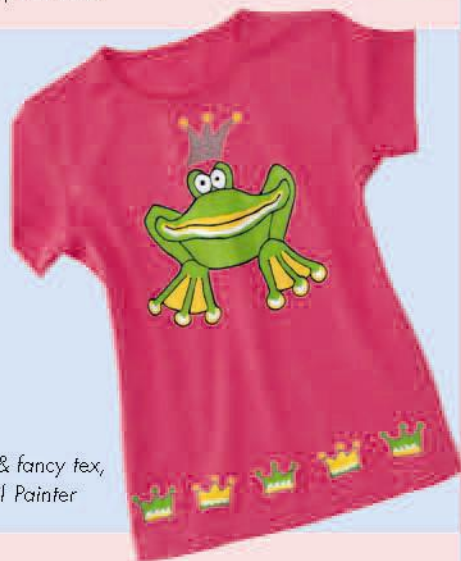
fun & fancy tex, Textil Painter

Днес можете да бъдете жабата-принц, пчела или принцеса. Дори Мечето Теди е облечен подходящо за случая.