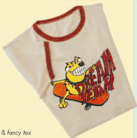
fun & fancy tex