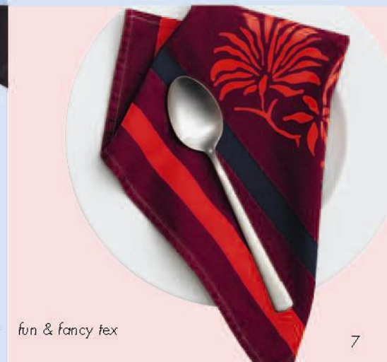
fun & fancy tex