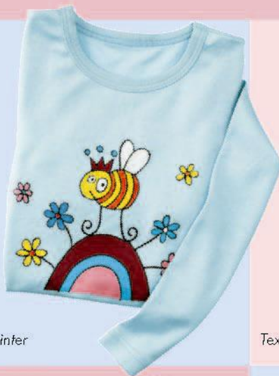
Textil, Textil Painter