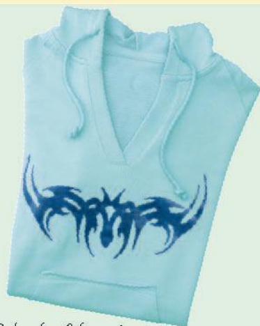
FashionColor, fun & fancy tex

Спортът е забавление. Особено когато носите такива страхотни дрехи. Боята е от Marabu, дизайнът и идеите - от вас: това е печеливша комбинация.