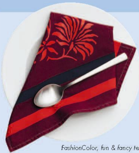
FashionColor, fun & fancy tex