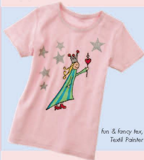
fun & fancy tex, Textil Painter

Днес можете да бъдете жабата-принц, пчела или принцеса. Дори Мечето Теди е облечен подходящо за случая.