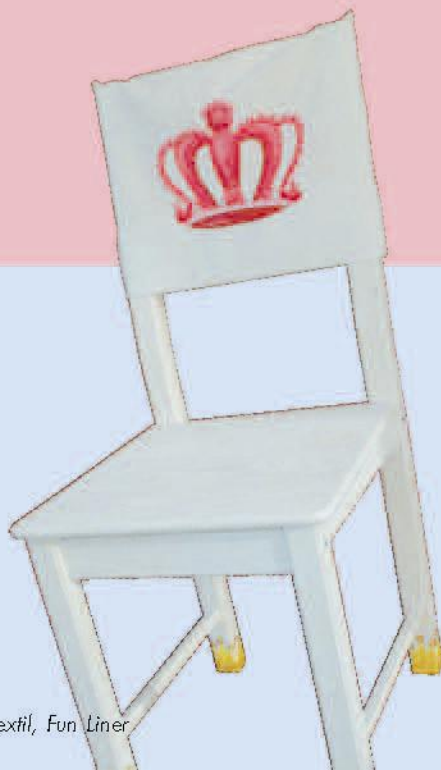
Textil, Fun Liner