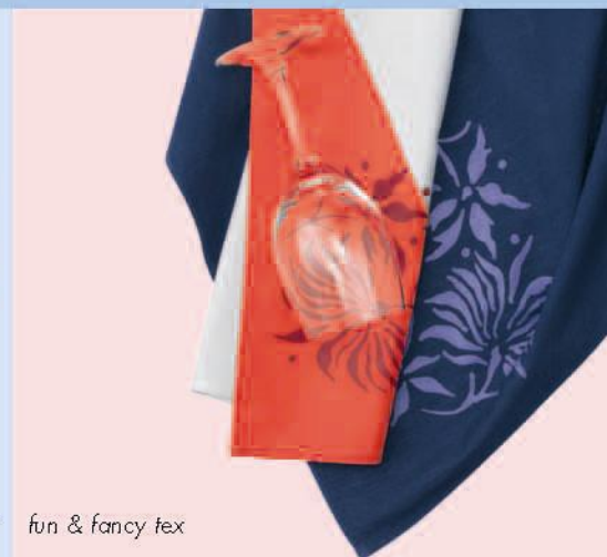
fun & fancy tex