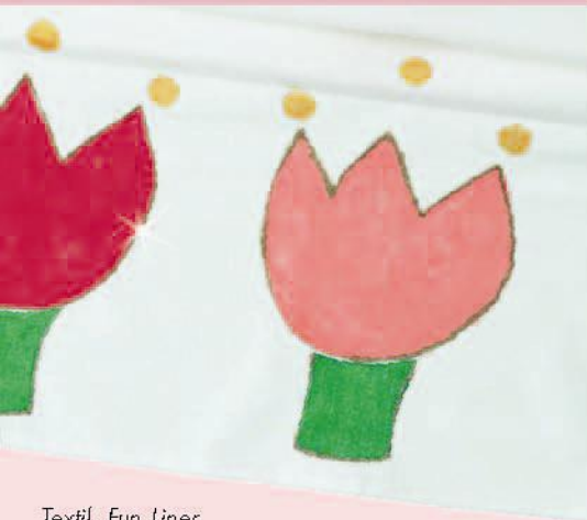
Textil, Fun Liner