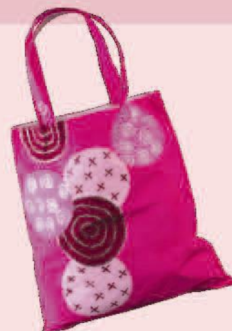
Textil plus, Fun Liner