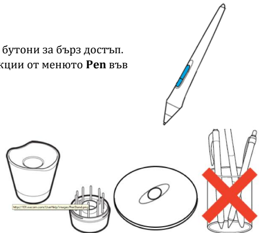
Стойките за писалката варират в зависимост от вида на таблета, който сте закупили.

Съвет: Не оставяйте писалката на устройството, когато не използвате писалката. Това може да причини проблеми, когато използвате мишка и може да попречите на компютъра ви да спи.