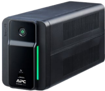
Easy UPS BX, BVX Series

We undersigned SCHNEIDER-ELECTRIC SAS declare under our sole responsibility, that APC by Schneider Electric branded products, when subject to state of the art installation, maintenance and use conforming to their intended purpose, according to applicable regulations and standards in the country where they are installed, to the supplier's instructions comply with Essential Requirements of following European Directives.