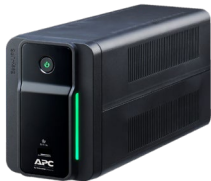
Easy UPS BX, BVX Series

We undersigned SCHNEIDER-ELECTRIC SAS declare under our sole responsibility, that APC by Schneider Electric branded products, when subject to state of the art installation, maintenance and use conforming to their intended purpose, according to applicable regulations and standards in the country where they are installed, to the supplier's instructions comply with Essential Requirements of following European Directives.