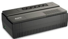
Easy UPS BV Series

References Références : BV500I, BV500I-GR, BV500I-MS, BV500I-MST, BV500I-MSX BV650I, BV650I-GR, BV650I-MS, BV650I-MST, BV650I-MSX BV800I, BV800I-GR, BV800I-MS, BV800I-MST, BV800I-MSX BV1000I, BV1000I-GR, BV1000I-MS, BV1000I-MST, BV1000I-MSX BX750MI, BX750MI-AZ, BX750MI-FR, BX750MI-GR BX950MI, BX950MI-AZ, BX950MI-FR, BX950MI-GR BX1200MI, BX1200MI-AR, BX1200MI-AZ, BX1200MI-FR, BX1200MI-GR BX1600MI, BX1600MI-AR, BX1600MI-AZ, BX1600MI-FR, BX1600MI-GR BX2200MI, BX2200MI-AR, BX2200MI-AZ, BX2200MI-FR, BX2200MI-GR BVX700LUI, BVX700LUI-AR, BVX700LUI-GR BVX700LI, BVX700LI-GR, BVX900LI, BVX900LI-AR, BVX900LI-GR BVX1200LI, BVX1200LI-GR, BVX1600LI, BVX1600LI-GR, BVX2200LI, BVX2200LI-GR